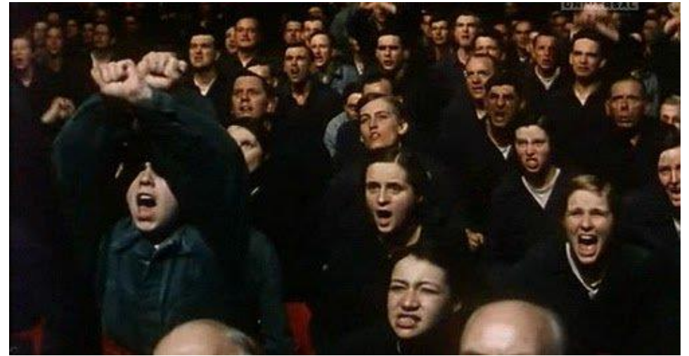
Imágenes de la película 1984