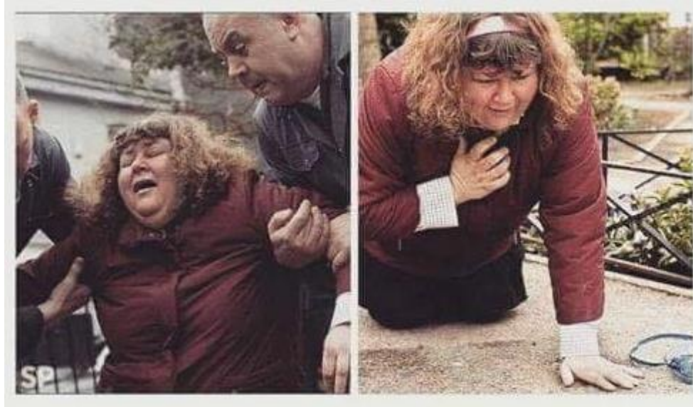
Recreación de mi reacción cuando me enteré de que se había muerto Ferlosio

Todo pura comedia: ni la cigarra era feliz cantando ni la hormiga necesitaba para nada el trigo almacenado: por necesidad cantaba la primera, por necesidad se afanaba la segunda.